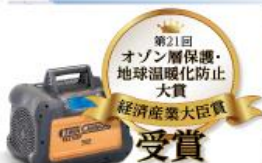
フルオロカーボン回収装置にて受賞