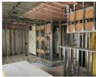
通電前の屋内作業に